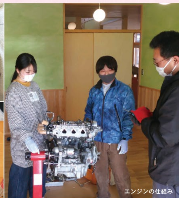
エンジンの仕組み