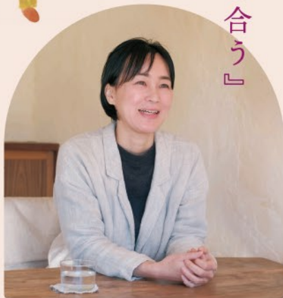
愛知シュタイナー学園 学童指導員