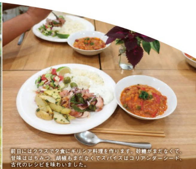
前日にはクラスで夕食にギリシア料理を作ります。砂糖がまだなくて、甘味ははちみつ、胡椒もまだなくてスパイスはコリアンダーシード、古代のレシピを味わいました。