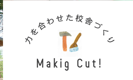
校舎内の壁という壁を塗りました