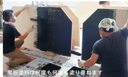
黒板塗料は何度も何度も塗り重ねます