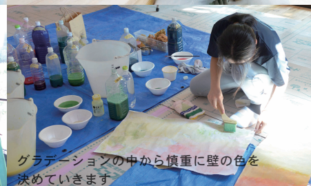
グラデーションの中から慎重に壁の色を決めています