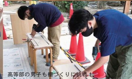
高等部の男子も棚づくりに挑戦！