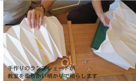
手作りのランペンシェードが教室を柔らかい明かりで照らします