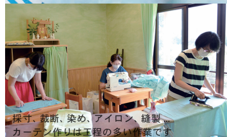
採寸、裁断、染め、アイロン、縫製...カーテン作りは工程の多い作業です