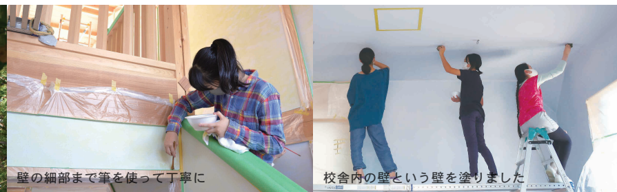
壁の細部まで筆を使って丁寧に

設計・施工は、南棟と同じく日進市の工務店「ナチュラルパートナーズ」さんに手掛けていただきました。