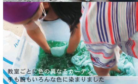
教室ごとに色の異なるカーテン。手も腕もいろんな色に染まりました